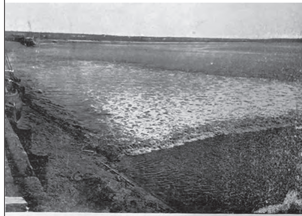
THE BORE (SHOWING RIVER BEND) MONCTON, N. B.