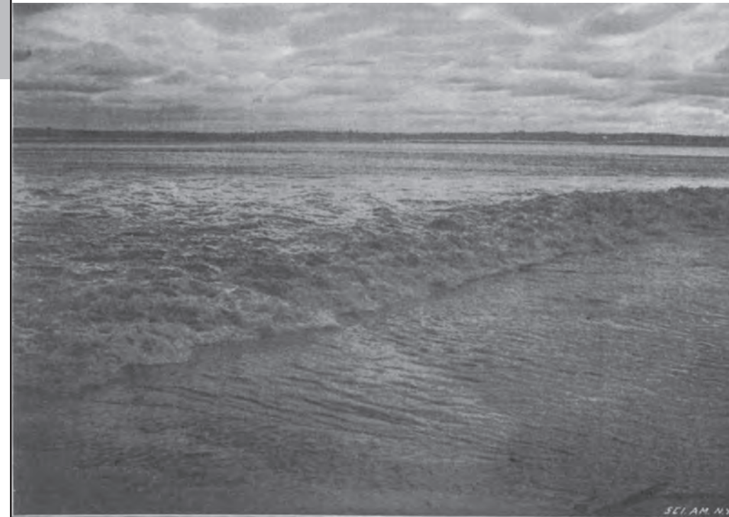
THE RUSH OF WATERS, OR THE "BORE," FIVE FEET FOUR INCHES HIGH, AT MONCTON, N. B.