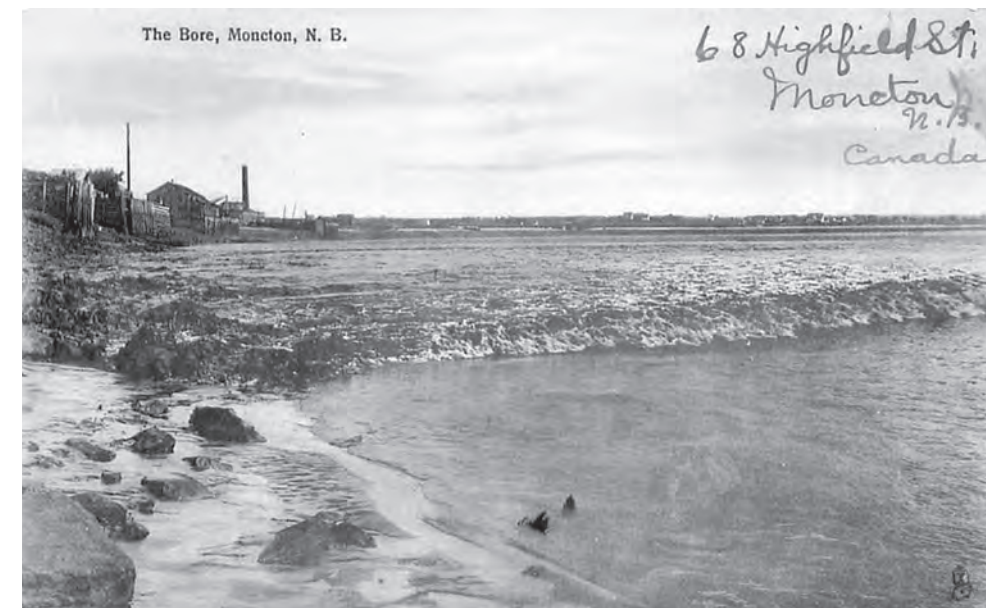
Carte postale fabriquée par Raphael Tuck & Sons, affranchie en 1916. Il semble que cette image soit issue du négatif original de Crandall, le rocher distinctif du premier plan ayant été supprimé.

l'image de Crandall, et la vague se trouve au même endroit. Il s'agit clairement de la même photographie de base, mais le gros rocher dans l'eau a été supprimé et remplacé par ce qui semble être des morceaux de bois dépassant de l'eau. Cette démarche visait vraisemblablement à éviter une violation des droits d'auteur.