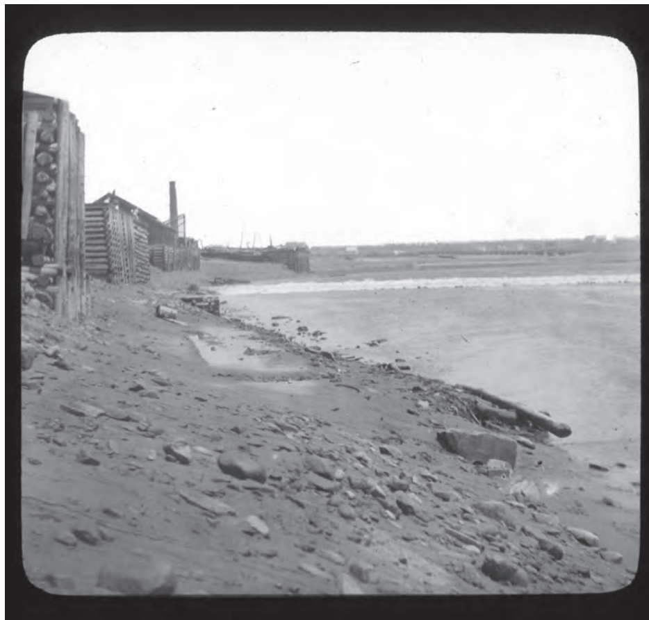
Diapositive sur verre montrant le mascaret à mi-distance. (Numéro P12\139 de la collection Smith Studio aux Archives provinciales du Nouveau-Brunswick.)