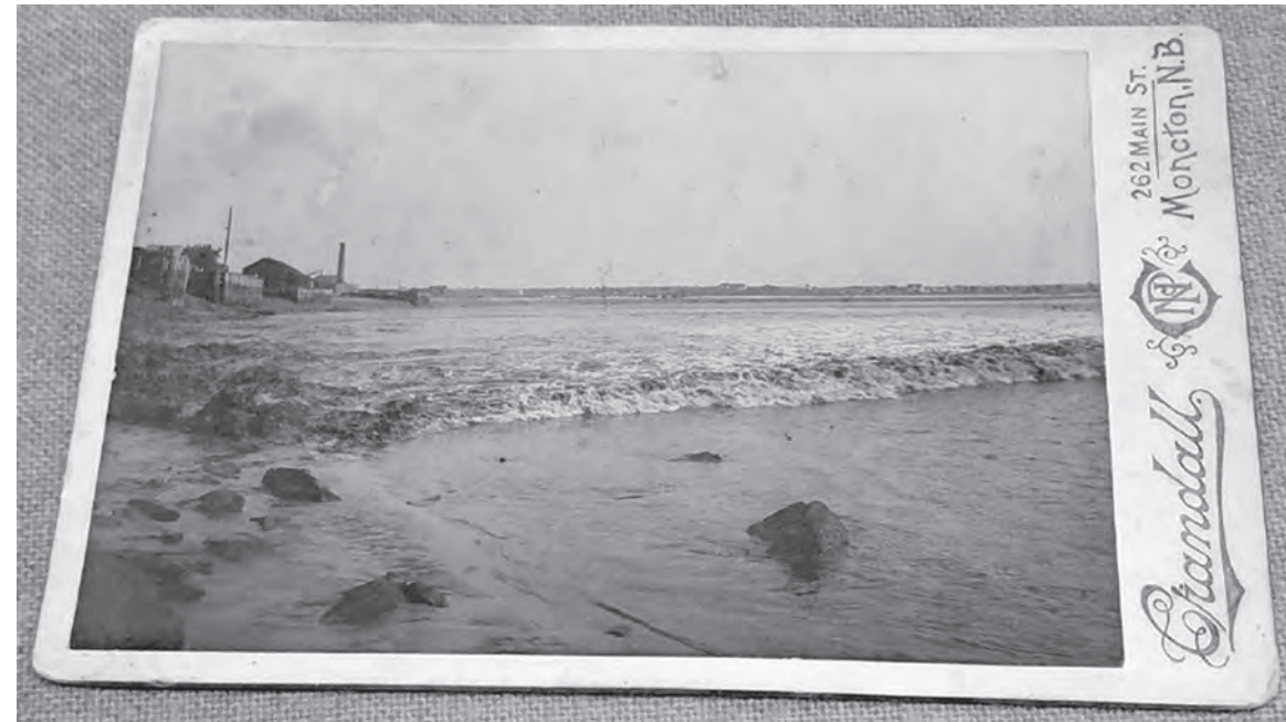
Carte professionnelle portant l'empreinte de Crandall.

La preuve que le titre fait référence à l'image de Crandall vient du fait que les Archives provinciales du Nouveau-Brunswick conservent un négatif en taille réelle dans la collection Erb. Curieusement, le négatif, tel qu'il est illustré ci-dessous, montre un peu moins la ligne de rivage que