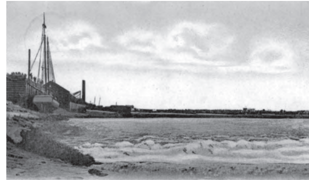
Carte postale datée de 1908. (collection du CEAAC par l'intermédiaire de Wikimedia Commons.)

La photo de titre de cet article montre un ciel sans nuages, typique de cette période. Prise par Percy Crandall, cette