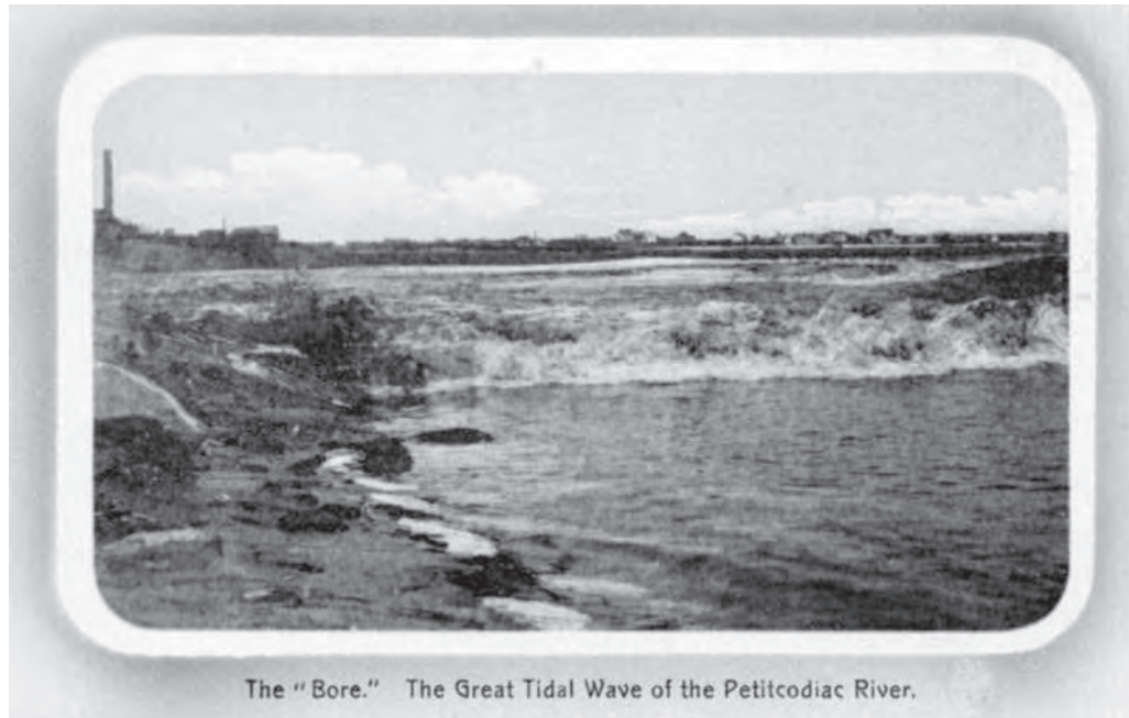
The "Bore." The Great Tidal Wave of the Petitcodiac River.