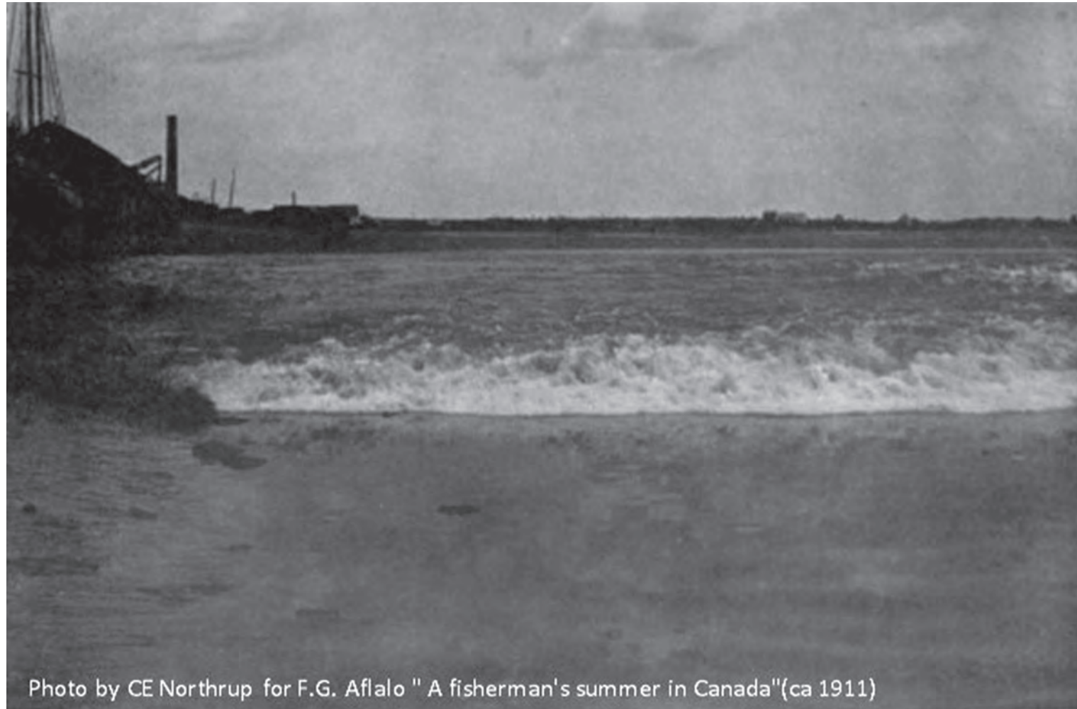
Photo by CE Northrup for F.G. Afalo " A fisherman's summer in Canada"(ca 1911)

Le livre a été publié en 1911, mais la photographie a probablement été prise avant 1901, car c'est à peu près à cette époque que Northrup a pris sa retraite en tant que photographe. Voici l'image obtenue, telle qu'elle est publiée dans le livre d'Afalo.